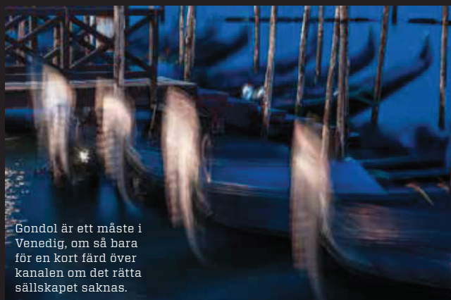
Gondol är ett måste i Venedig, om så bara för en kort färd över kanalen om det rätta sällskapet saknas.

17 euro – en klar signal om att besöket bör stanna där!