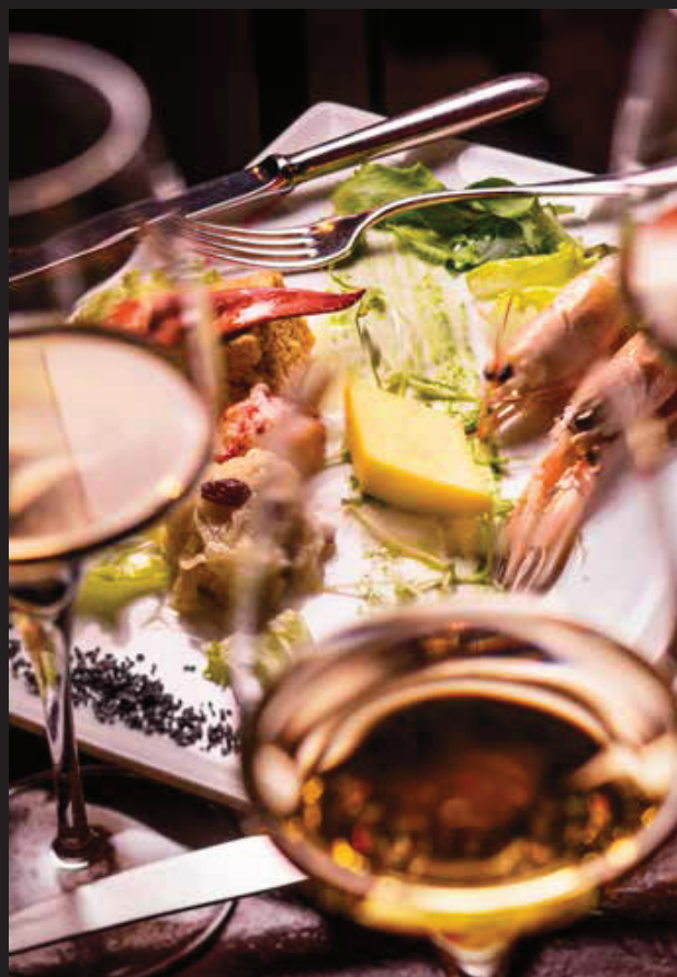
En avsmakning av otaliga fisk- och skaldjursrätter är en perfekt start på middagen på restaurangen La Caravella.

Det enda som är riktigt billigt i Venedig är vinet. Gå in på vilken vanlig bar som helst och beställ ett glas vitt eller rött. Det kostar sällan mer än ett par euro. OK, glaset är små. Venetianerna kallar glaset för "en skugga". De beställer un ombra , men medvetna om storleken använder de ofta diminutivet un ombretta . Uttrycket härrör från Markusplatsen, där det i forna tider pågick marknad. Före vår tids kylanläggningar var det viktigt att vinet stod i skuggan. Den enda skugga som finns på detta torg är den som kommer från det 98 meter höga klocktornet. Därför fick vinet ofta flyttas. Och så uppstod uttrycket att "ta sig en skugga".